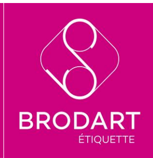
Logo Brodart Étiquette