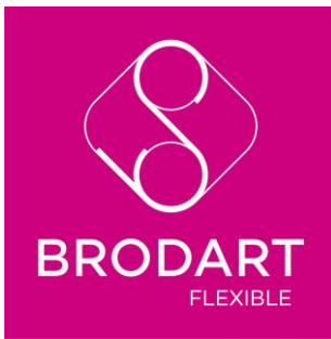
Logo Brodart Flexible